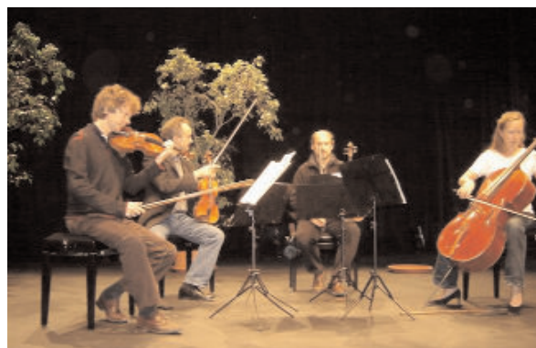
Le Quatuor LUDWIG

Des artistes, de renommée internationale, invités par RITMY.