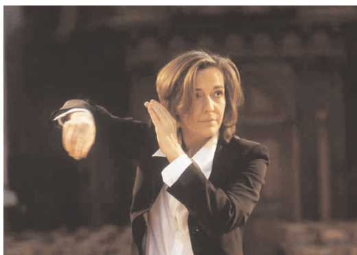
Laurence EQUILBEY Chœur Accentus