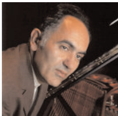
Abdel Rahman El BACHA Pianiste